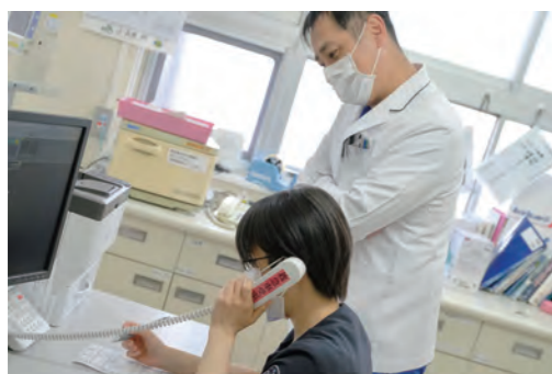
救急隊から搬送依頼の連絡を受ける