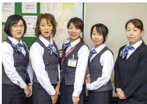
地域連携室スタッフ

令和元年7月31日、当院は茨城県知事より『地域医療支援病院』の承認を受けました。「地域医療への貢献」は当院のたいせつな基本理念のひとつであり、このたびの承認は誠に有難いことと受け止めております。また、承認に至るには地域の医療機関のみならず、そして患者さまとご家族さまのご理解とご協力無くしては成し得なかつたものと深く感謝申し上げます。 『地域医療支援病院』とは、患者さまに身近な地域の中で医療が提供されることが望ましいという観点から、地域の医療機関からの紹介患者さまに対する医療を提供し、地域の医療機関の先生方が医療機器等を共同利用できる体制を整えているこ