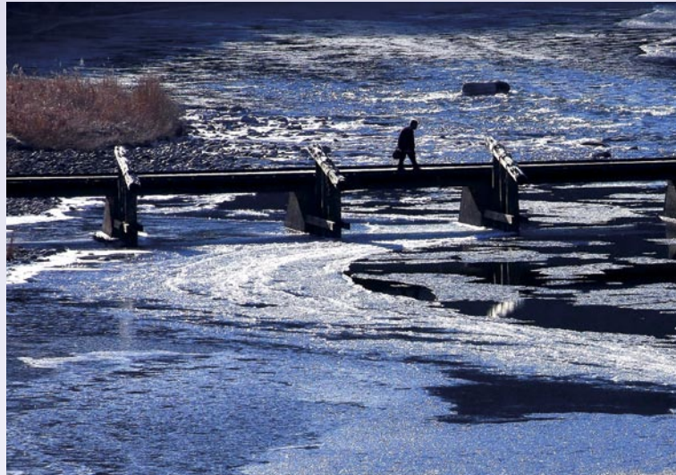
写真／久慈川のシガ（太子町）