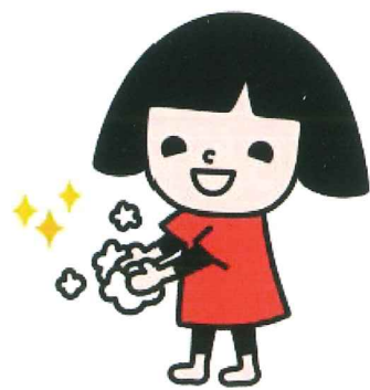
コロナ対策笑味ちゃん 手洗い