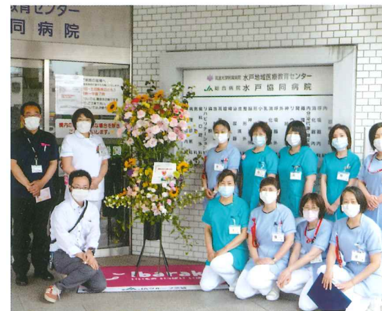
フラワースタンドで医療関係者を応援、JAグループ茨城花き流通部様より贈呈されました