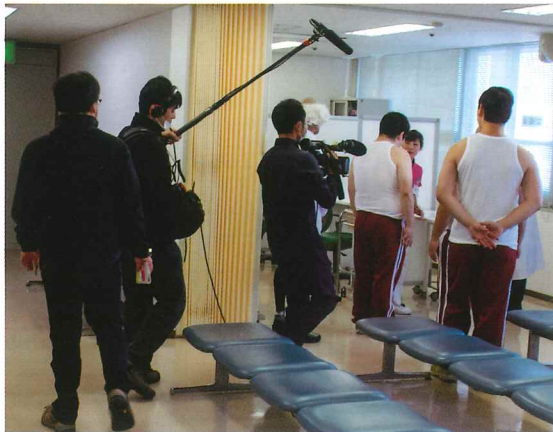
1月10日NHK BS1 自転車情報番組「チャリダー★」の収録が当院を舞台に行われました