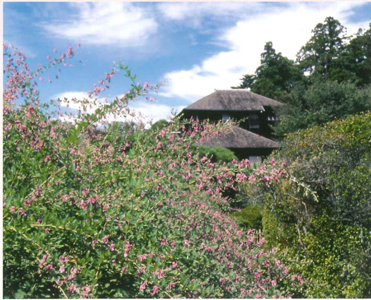
写真／偕楽園の萩（水戸市）