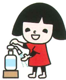
コロナ対策笑味ちゃん 消毒液

程度危険なものでしょうか？ K ・・残念ながら現時点ではまだはっきりした事はわかっていません。ただ可能性として、御年寄や持病があるなど、体の弱った方は重症になりやすいのではないかと推測されていて注意が必要ですよ。