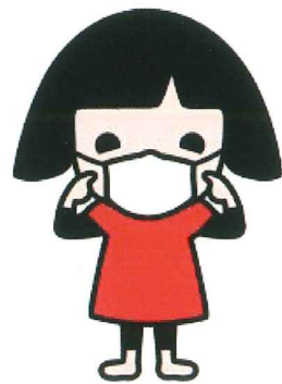
コロナ対策笑味ちゃん マスク