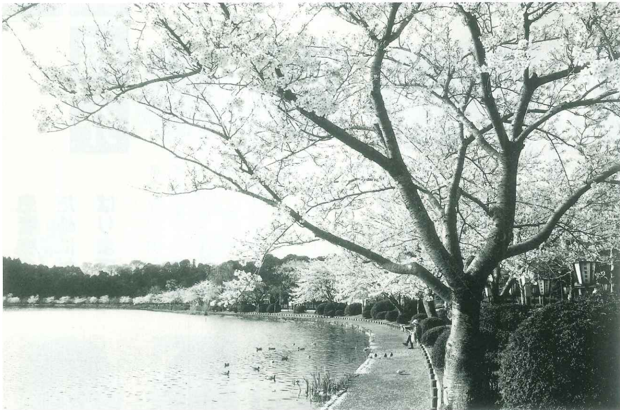
桜満開の千波湖畔

Speak for Mitokyo-do Hospital and Patient !!